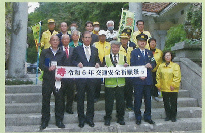
白銀堂にて交通安全祈願祭