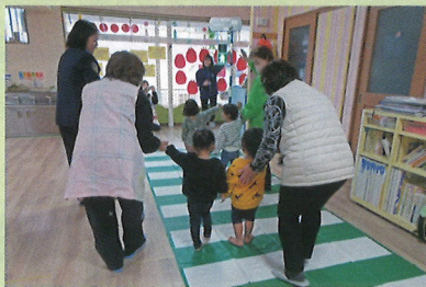
保育園児への交通安全教室