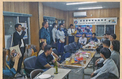
飲酒運転体験教室