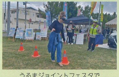
うるまジョイントフェスタで飲酒ゴーグル体験