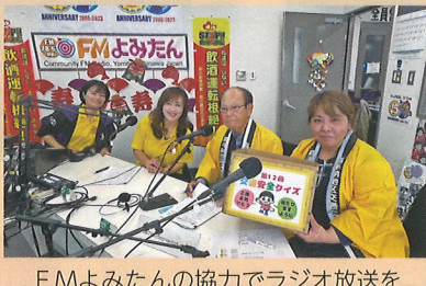
FMよみたんの協力でラジオ放送を通じて交通安全クイズを実施