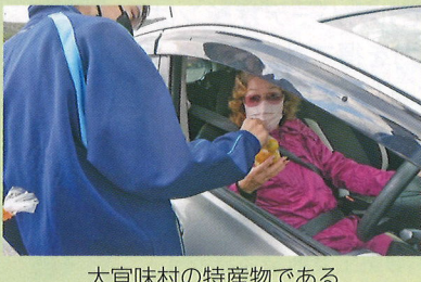
大宜味村の特産物であるシーワーカーを配布して安全運転PR