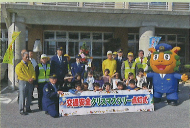
交通安全クリスマスツリー点灯式