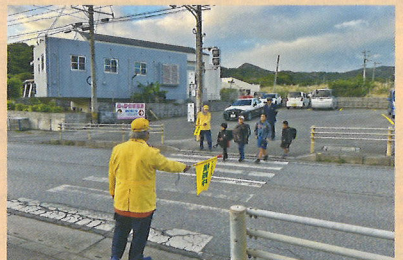
早朝の街頭交通誘導