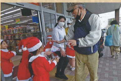
児童による交通安全チラシ配布