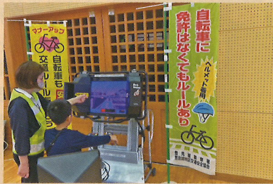
自転車シミュレーターの活用