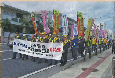
開始式におけるパレード