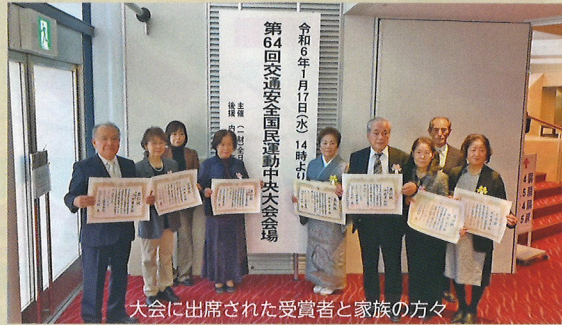
大会に出席された受賞者と家族の方々