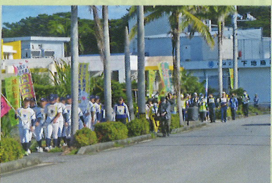
交通安全PRウォーキング