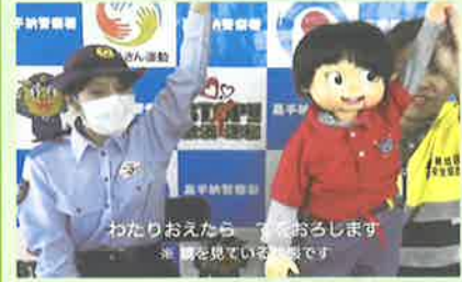
幼児交通安全教室