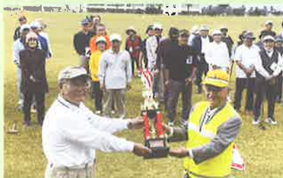
交通安全グラウンドゴルフ大会(会長争奪杯)