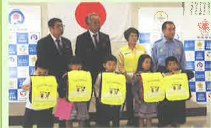
ランドセルカバー贈呈式