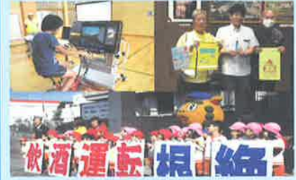
飲酒運転根絶街頭キャンペーン