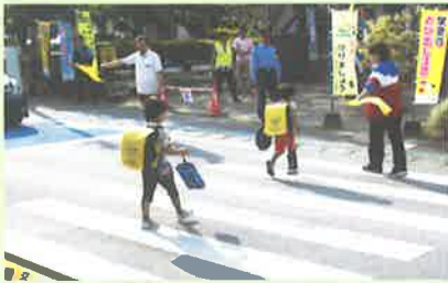
新一年生交通安全指導