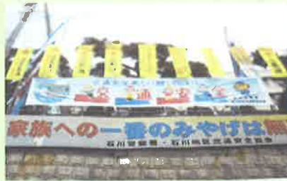
交通安全鯉のぼり作戦