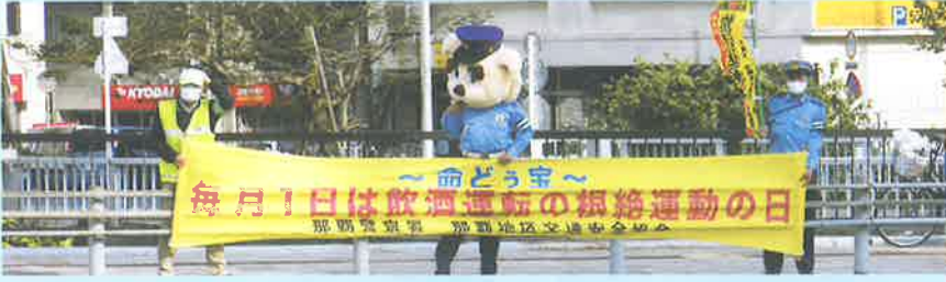
飲酒運転の根絶運動の日