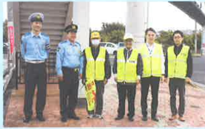
交通安全運動協働激励巡視