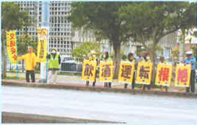
飲酒運転根絶街頭広報