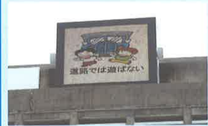
大型ディスプレイ (交通安全広報)