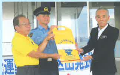
ランドセルカバー贈呈式