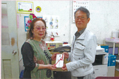
浦添地区 キャラバン 激励