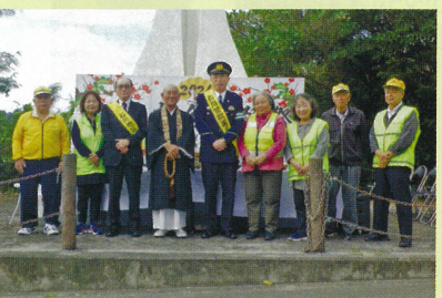
石川地区 交通安全祈願祭