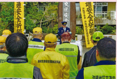
沖縄地区 交通安全祈願祭