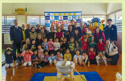
本部地区 交通安全祈願新春餅つき大会