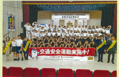
宜野湾地区 開始式