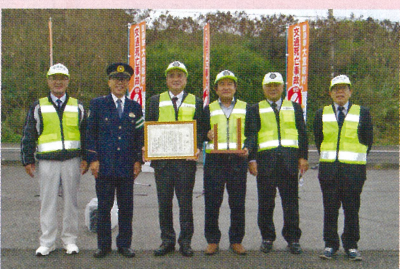
名護地区 大宜味村交通死亡事故ゼロ10年達成