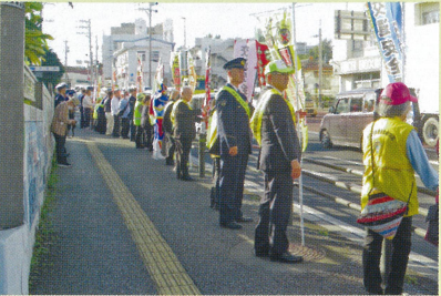
与那原地区 交通安全アイキャッチ作戦