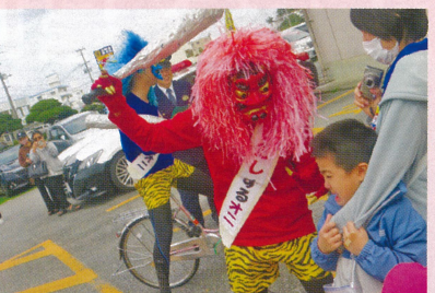
宮古島地区 交通安全豆まき作戦