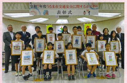
うるま地区 交通安全ポスター表彰式