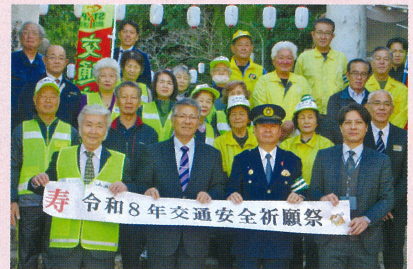
糸満地区 交通安全祈願祭