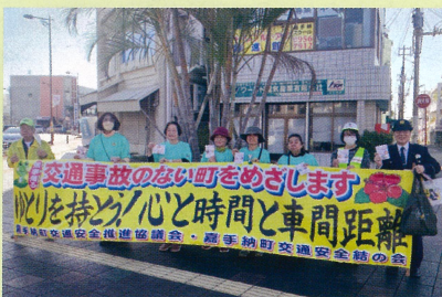
アイキャッチ活動