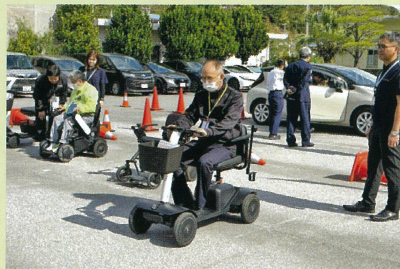
シニアカー体験乗車会