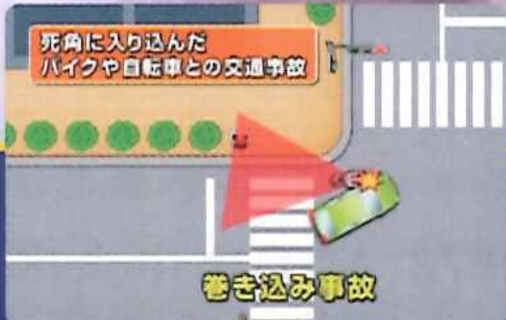
死角に入り込んだ バイクや自転車との交通事故