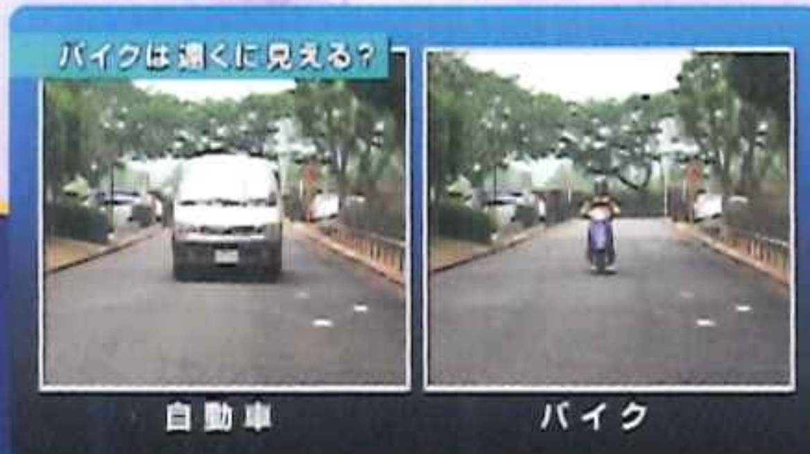
バイクは速く見える?